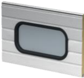
664 x 334 mm