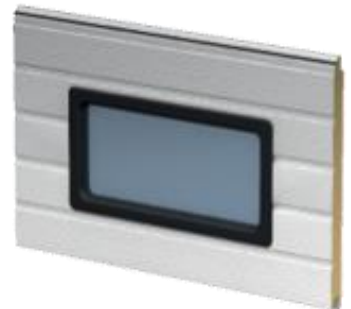
638 x 334 mm