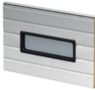
608 x 202 mm