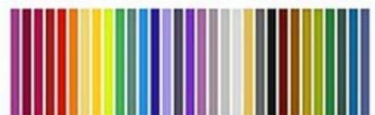
Alutech doors can be painted in any RAL color upon Client's request * RAL codes shown here are the nearest to Alutech colors