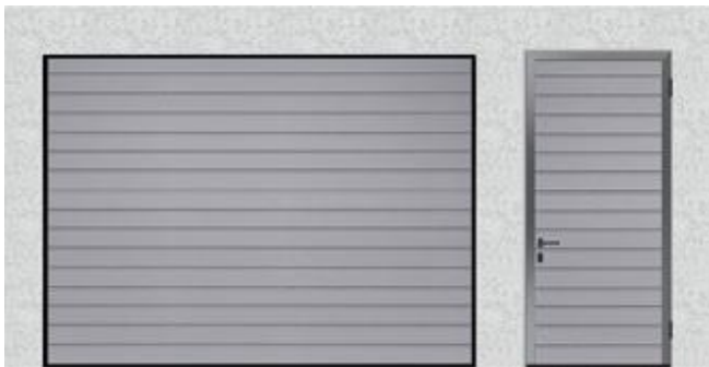
Small Rib kapea vaakaurakuvio