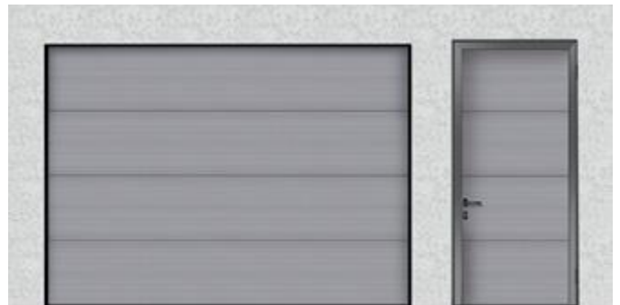
Mikroura, tiheä vaakaurakuvio